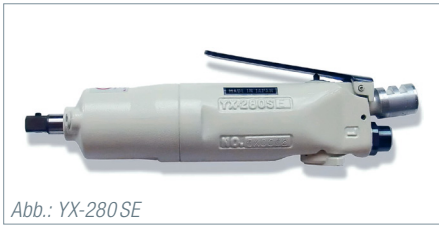
Abb.: YX-280 SE