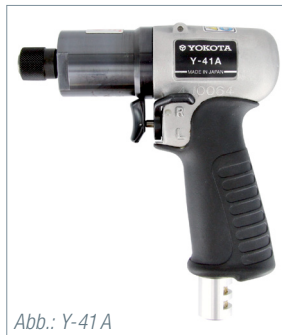
Abb.: Y-41 A

Um alle Vorteile der Impulsschrauber erfolgreich zu kombinieren, ist es sehr wichtig, dass für jede Schraubverbindung der richtige Impulsschrauber verwendet wird. Jede Schraubverbindung ist anders. Wir beraten Sie gern bei der Auswahl des passenden Schraubers für Ihren konkreten Schraubfall.