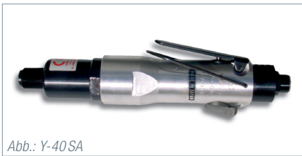
Abb.: Y-40 SA

Yokota Impulsschrauber der Y-Serie sind ähnlich der Baureihe YX, werden jedoch durch einen Doppelkammer-Luftmotor angetrieben. Dadurch wird das eingestellte Drehmoment noch schneller erreicht. Diese Modelle erzeugen eine höhere Anzahl Impulse pro Sekunde und erzielen dadurch eine noch höhere Wiederholgenauigkeit mit einer kürzeren Produktionstaktzeit.