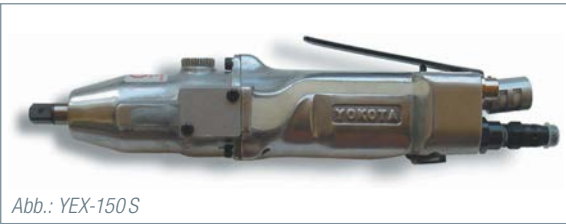
Abb.: YEX-150 S

Yokota entwickelte vor mehr als 30 Jahren „intelligente“ Schraubwerkzeuge – heute weithin bekannt als System-schrauber. Die mit elektronischer Drehmomentkontrolle ausgestatteten Impulsschrauber dienen zur dokumentierten Montage von Schraubverbindungen. Das System bietet Abschaltung des Impulsschraubers zum gewünschten Drehmoment mit weiteren Angaben wie zu niedriges oder zu hohes Drehmoment, Fehlersuche bzw. -meldung, Zählen der Verschraubungen, Gruppenkontrolle, Linienproduktionsmanagement, Datenspeicherung, etc.