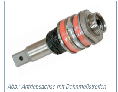
Abb.: Antriebsachse mit Dehnmessstreifen

Das System kann im Montageprozess integriert werden zum prozessicheren Verschrauben.