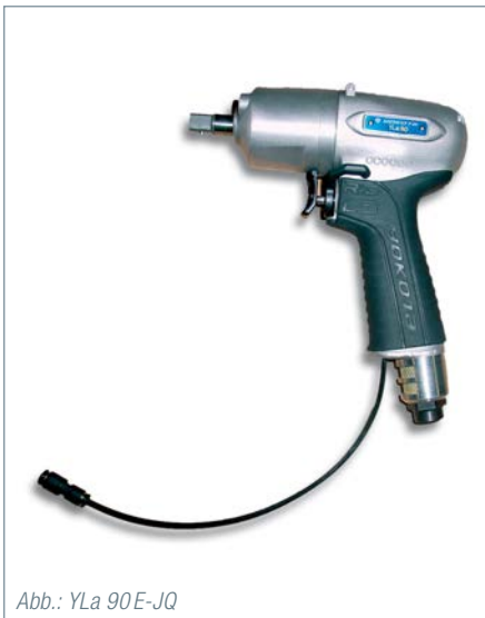
Abb.: YLa 90E-JQ