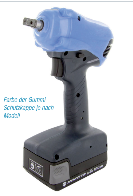
Farbe der Gummischutzkappe je nach Modell

Yokota YZ-NP Akku-Impulsschrauber sind leistungsstark, sehr genau und sie haben vor allem so gut wie kein Reaktionsmoment. Das sehr kompakte Design bietet eine gute Zugänglichkeit zur Verschraubung.