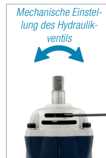
Mechanische Einstellung des Hydraulikventils