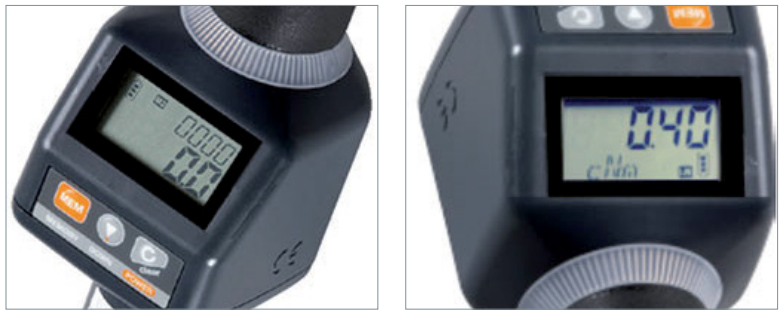
Der mehrfarbige LED-Indikatorring zeigt den aktuellen Drehmomentstatus rundum sichtbar an.