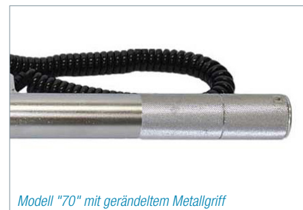
Modell "70" mit gerändeltem Metallgriff