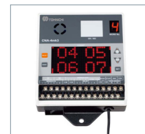
Optional: Anzahlprüfer CNA-4mk3.

Das eingestellte Drehmoment kann nur mit einem Spezialwerkzeug (separat erhältlich) geändert werden, so dass der Bediener das Drehmoment nicht versehentlich ändern kann.