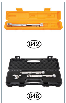
Option: Kunststoff-Transportkoffer (Farbe je nach Typ/Modell).

Ein deutliches Klickgeräusch durch den internen Kippmechanismus signalisiert den Abschluss des Anziehvorgangs, sobald das eingestellte Drehmoment erreicht ist.