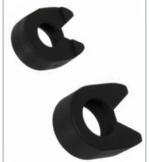
Optional: Schutz-Abdeckung für den Ratschenkopf.