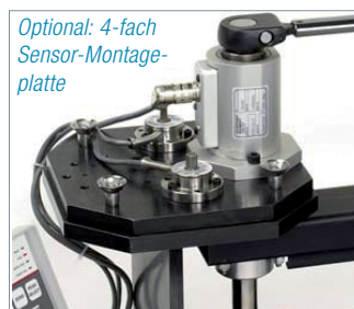
Optional: 4-fach Sensor-Montageplatte