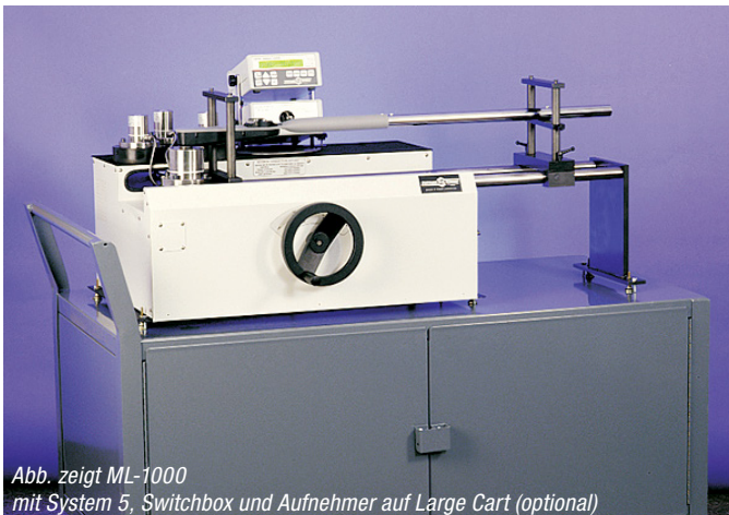
Abb. zeigt ML-1000 mit System 5, Switchbox und Aufnahme auf Large Cart (optional)