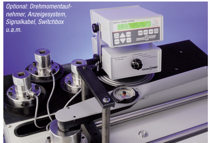
Optional: Drehmomentaufnahme, Anzeigesystem, Signalkabel, Switchbox u.a.m.